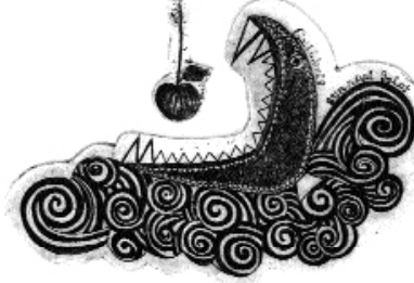
Mine Gündüz, C3, (70x105), 1998

• 23 Mayıs 1996'da Belçika, Sint-Niklaas'da açılan "Tilki" konulu exlibris