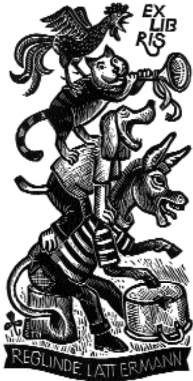
Wilhelm Richter (?), X3, (128x68), 1996