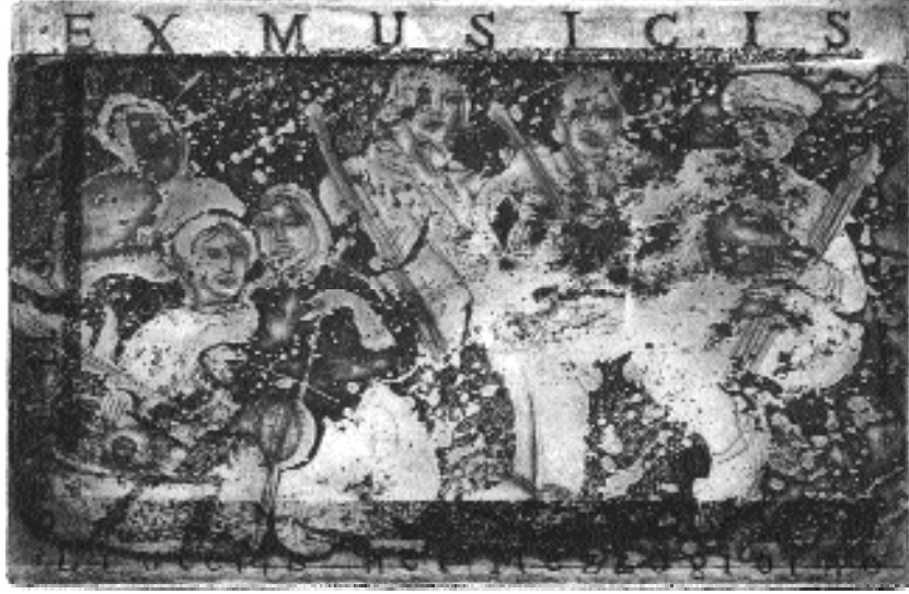
Sema Ilgaz Temel, C3, (10x15 cm), 1997, Ortona Uluslararası "Ex Musicis" Exlibris Yarışması, 3. lük Ödülü