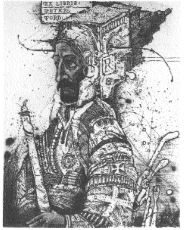
Oleg Denisenko (Ukrayna), MT (C), (86x68), 1994