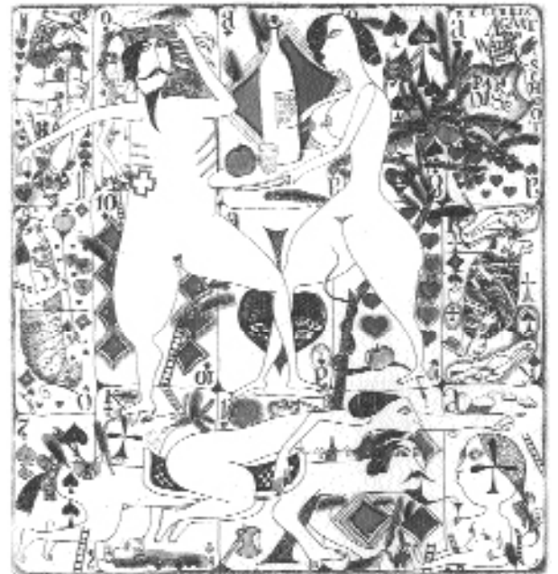
Yuri Nozdrin (Rusya), C3/col, (125x118), 1995