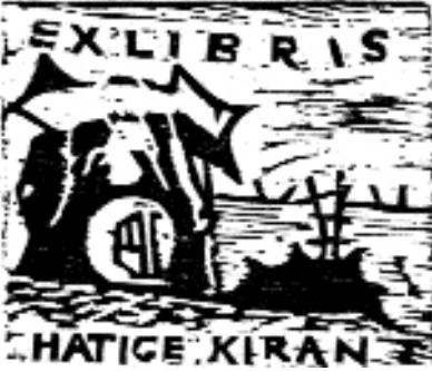
Hasan Kiran, X1, (83x98), 1997