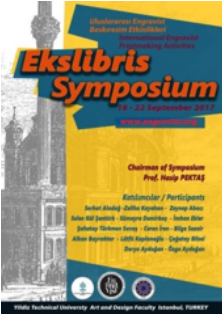
Görsel 4: Ekslibris Gravür Çalıştayı Afişi, 2017

Baskı resim, duygu ve düşüncenin kalıplar aracılığıyla başka bir yüzeye aktarımı ve birden fazla kopyanın elde edilebilirliği esasına dayanır. Çoğaltım temeline dayanan bu sanat alanında, aktarılmak istenen görselin geçtiği aşamalar, kaç tane baskı elde edildiği ve bütün baskı aşamalarını yöneten sanatçının tasarımcı kimliği çok önemlidir (Fırıncı, 2013: 128). Ekslibris çalışmaları çoğaltılabilir olma zorunluluğu taşıması sebebiyle farklı baskiresim teknikleri ile uygulanabilir. Çelik oyma, ağaç baskı, taşbaskı, linol baskı, akuatinta, kuru kazıma, mezzotint gibi tekniklerin yanında bilgisayar destekli programlar ile ekslibris çalışmaları yapılabilir. Gerçekleştirilen Ekslibris Gravür Çalıştayı’nda tercih edilen yöntem linol baskı tekniği olmuştur.