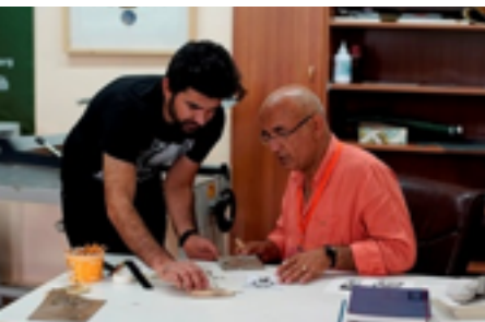
Görsel 5: Ekslibris Gravür Çalıştayı’ndan Görüntü, 2017